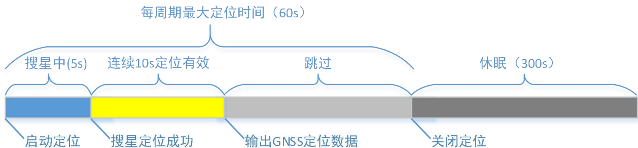
周期模式定位成功流程